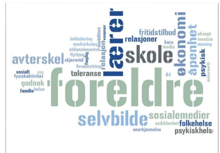
Figur 2: Resultater fra arbeidsøkt på spørsmålet «Hva er de største utfordringene for barn og unge i Modum?».