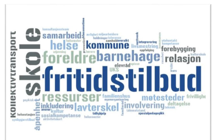
Figur 3: Resultater fra arbeidsøkt på spørsmålet: «hva er de viktigste prioriteringene for å skape et godt oppvekstmiljø i Modum?».