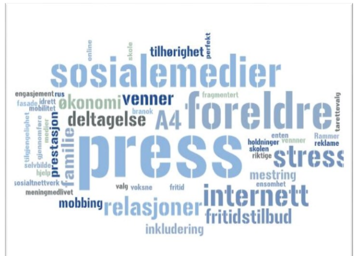
Figur 1: Resultater fra arbeidsøkt på spørsmålet «Hvilke faktorer påvirker barn og unges oppvekstvilkår i Modum?».

Folkehelseinstituttet peker også ut en tydelig kurs for godt oppvekstmiljø og folkehelse for barn og unge. De framhever at positive påvirkningsfaktorer som opplevelse av glede, mestring, selvstendighet og mening som styrker sosial og emosjonell kompetanse, kan være viktige mål i folkehelsearbeidet.